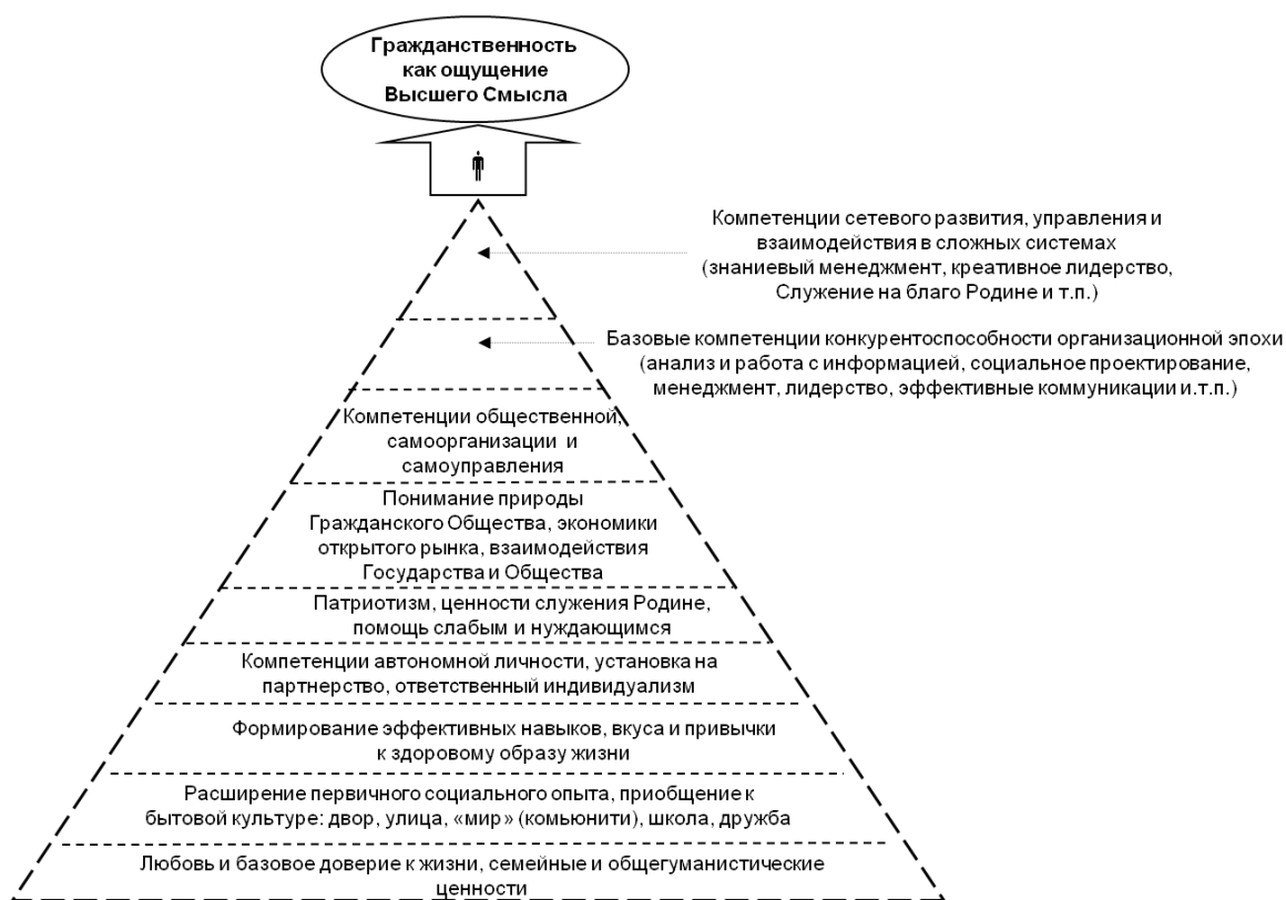
Рисунок 2 Декомпозиция ценностей в рамках программы